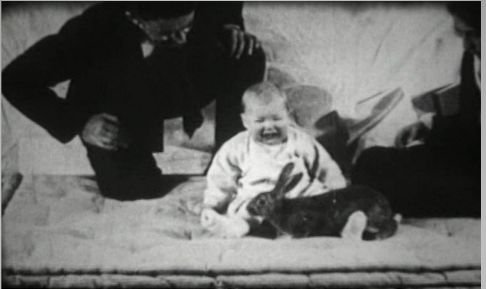
Eksperiment sa malim Albertom